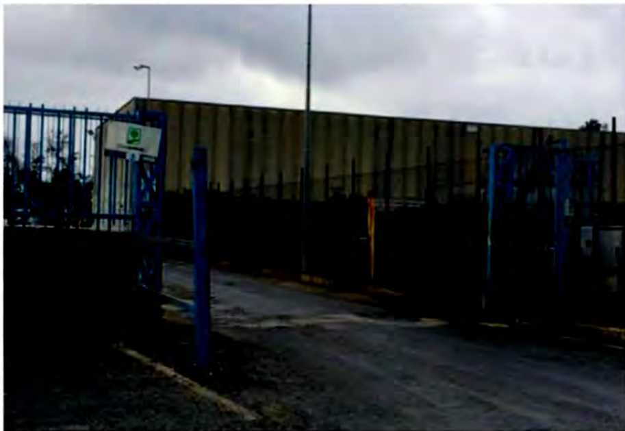
L'ingresso dell'ecocentro della Cisterna Ambiente

Gli accertamenti, a quanto pare, sono stati effettuati solo