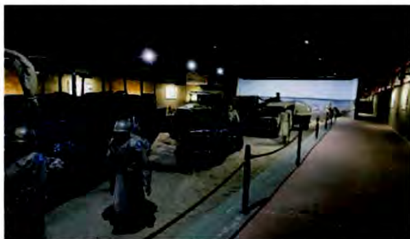
A sinistra un dettaglio di Piana delle Orme.